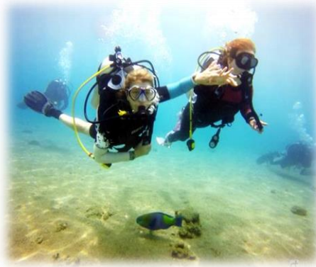
תמונה 6. צוללת עיוורת מתקשרת עם בת-זוגה באמצעות שפת הסימנים.

(תמונה 6), גם עד רמת שרשרת דגים (מפלסטיק) שיש לו על המאזן, ואנחנו נותנים לו למשש את הדגים שרואים. זה פשוט מאוד. כל מי שבא ורוצה לצלול עם עיוור מקבל את הקובץ הזה, וברגע שהוא מגיע למפגש הראשון עם העיוור הוא עובר יחד אתו על הסימנים. אני יכול להגיד לך שההתקשרות היא מלאה, זאת אומרת, העיוורים יוצאים וכאילו מספרים מה הם ראו, עד כדי כך. (ריאיון 4, שורה 98)