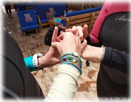
תמונה 8. הסבר באמצעות שפת הסימנים על מנח הגוף במים בתרגיל איזון

תופס את ידו של העיוור ומסביר לו בדיוק כיצד צריך להיות מנח הגוף (תמונה 8). כדי להגיע לאיזון מושלם, מלבד איפוס הכוחות הפועלים על הגוף, צוללים "רגילים"