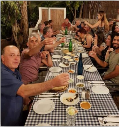
תמונה 1. חוויה חברתית: ארוחה משותפת

(תמונה 1) 4 , שכנראה חשובה להם מהצלילה עצמה. הכול לגיטימי. אצל עיוורים זה מורכב, כי הם בודדים יותר. יש להם בעיה בחיי חברה, כי לעיוור יש בעיה להתערות. אתה תראה את זה כשתהיה בסביבה של עיוור. הוא לא תמיד יודע מה קורה סביבו, אז אם תושיב אותו מבלי להתייחס אליו, הוא יישב כמו מומיה. אתה מבין? צריך להיות רגישים בנושאים האלה. (ריאיון 2, שורה 55)