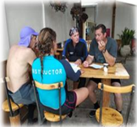
תמונה 7. התכנסות המדריכים לפני התדריך לצלילה

למתנדבים ול"חברים" (ריאיון 3, שורה 31), ואם מדובר בקבוצה גדולה הם יחלקו אותה לשתי קבוצות צלילה ויעבירו תדריך – הפעם מפורט יותר. לכשיסיימו, כל מתנדב "ייסגור פינות" אחרונות עם החבר שעמו הוא צולל. רק לאחר מכן, כשכולם יודעים מה בדיוק הם עושים, הם מתחילים בהתארגנות. זהו שלב ארוך מאוד ביחס לצלילה רגילה, וזאת בעקבות חוסר היכולת לשאת את הציוד למים והתלות של החבר בבן-זוגו. חוג הצלילה של אתגרים מצא דרך להקל את שלב הכניסה – על-ידי כיסא גלגלים המותאם לכניסה למים ולנסיעה על חול הים הרך.