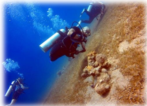
תמונה 2. צולל ללא גפיים תחתונות המשתמש בידיים כדי לנוע במים

נוסף לזווית הראייה של העצמת המדריכים, רוני מתייחס לזווית הראייה של הצוללים עם המוגבלות, כפי שהוא תופס אותה: