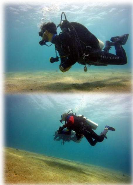
תמונה 5. צולל עם סנפירים המשתמש ברגליים וצולל ללא סנפירים המשתמש בידיים כדי לנוע

לילה עם אנשים עם מוגבלות זה ערך, וגם שמירה על הסביבה הימית זה ערך.