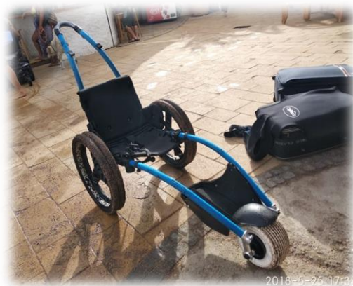
תמונה 4. כסא גלגלים מיוחד המסייע בכניסה למים לצוללים הזקוקים כך

כניסה למים. רון התייחס לשלב הכניסה למים כחלק משמעותי של הפעילות, המתקשר הן להכנות והן לתדריך. הוא הסביר את ההתאמות שנדרשות עבור צוללים עם פאראפליגיה בשלב הכניסה למים ופירט את התפקידים של מוביל הקבוצה: